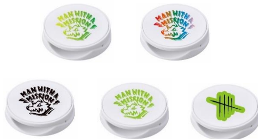
限定 スマホグリップ (デザイン全5種)