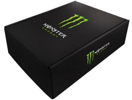
モンスター2本入り限定BOX (バンドオリジナルカード付き)