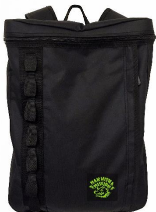
限定 バックパック

2本同時購入でゲット…オリジナルステッカー 合計30枚 ※各店につき MAN WITH A MISSION オリジナルステッカー 5種×5枚と、モンスターステッカー1種×5枚 ※なくなり次第終了