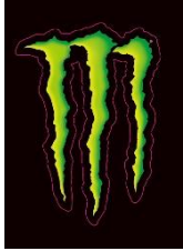
オリジナルステッカー (バンドステッカー5種とモンスターステッカー1種)