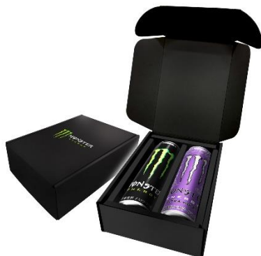
モンスターウルトラバイオレット スペシャルボックス

名称 : 「Repost to Win!モンスター ウルトラバイオレット発売記念キャンペーン」 実施期間 : 3月12日 (火) ~3月18日 (月) 23:59まで 応募方法 : ①モンスターエナジージャパン公式X (旧Twitter) アカウント (@MonsterEnergyJP) をフォロー ② @MonsterEnergyJP から投稿された対象の投稿をリポスト 公式X (旧Twitter) URL : https://twitter.com/MonsterEnergyJP 賞品 : モンスター ウルトラバイオレット スペシャルボックス (モンスター ウルトラバイオレットとモンスターエナジー 各1本入り) …抽選で1,000名様 当選通知方法 : キャンペーン期間終了後、当選者の方へ公式X (旧Twitter) アカウントより、 ダイレクトメッセージをお送りいたします。 その後、送付先情報をご連絡頂き、当選賞品をお送りさせていただきます。