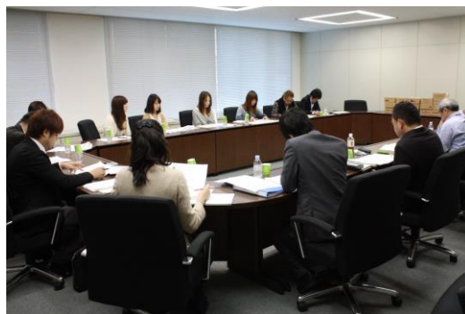
プレゼンテーションの様子