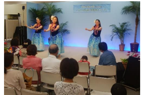
過去のステージイベントの様子