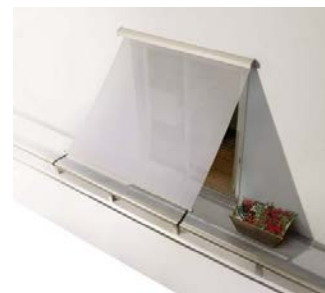
アウターシェード