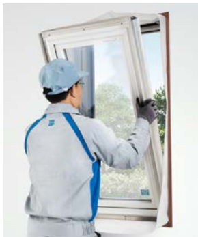
かんたんマドリモ