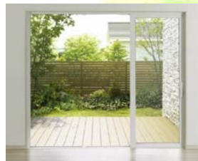
APW431 大開口スライディング