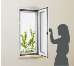
APW430 ツーアクション窓