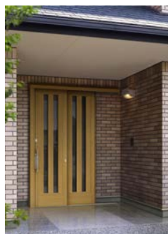
かんたんドアリモ