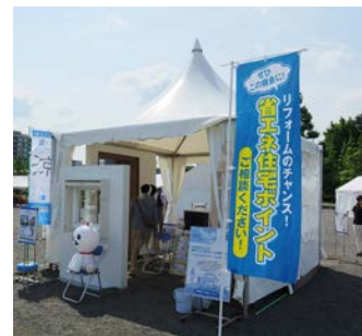
↑ 2015年度のテントブース