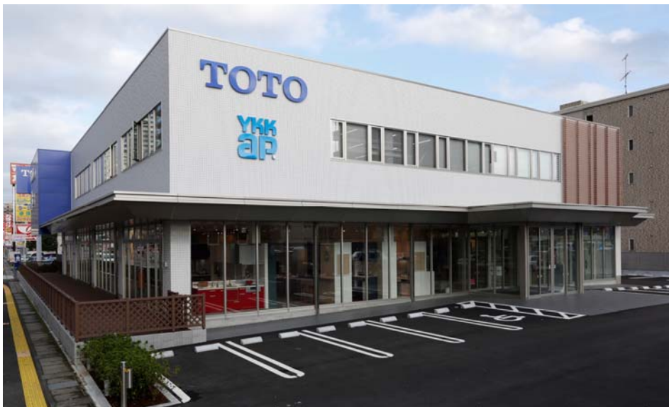
ショールーム外観

また、同じ中部エリアでは、 2016年3月に「TDY名古屋コラボレーションショールーム」(大名古屋ビルヂング内)の開設を予定 しており、静岡と合わせて、中部エリアでの「グリーンリモデル」提案の強化を図ります。