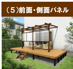
(5)前面・側面パネル