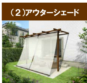
(2)アウターシェード