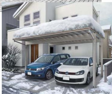
春～秋は明るい車庫空間に！