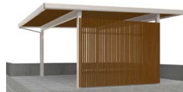
スクリーンパネル (2型 たて格子)