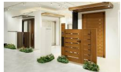
YKK AP : 玄関コーナー