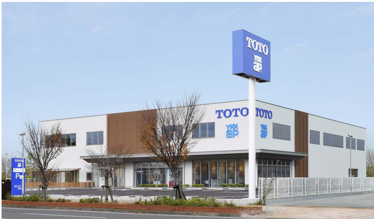
ショールーム外観

また、コラボレーションショールームでリモデルクラブ店(※2)と連携したイベントを開催するなど、住まいづくりや商品を提案・提供する場として活用し、地域に貢献してまいります。