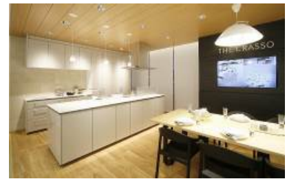
TOTO : システムキッチンコーナー