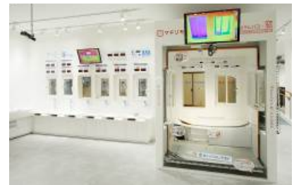
TYコラボ : 浴室+窓リフォームコーナー