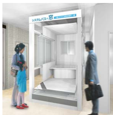
システムバス+窓 「お風呂の窓コーナー」