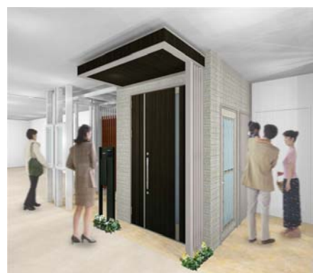
スマートドア+エクステリア 「ドアえらびコーナー」