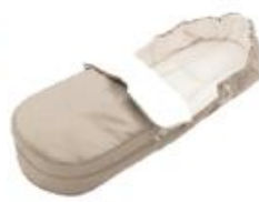
ソフトバッグ ※スクート専用