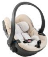
イージーゴ-by ビーセーフ