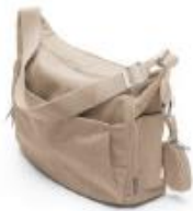
チェンジングバッグ