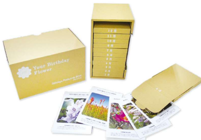
専用箱入りセットのイメージ

身近なお花から、初めて聞く珍しいものまで、日めくり的に毎日違う花言葉をお楽しみいただけます。