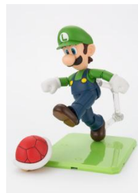
専用台座でアクションがきまる