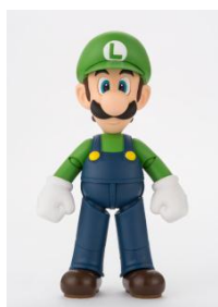
ルイージらしい細身で長身なスタイルを再現