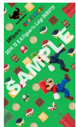
プレゼントの壁紙 ※イメージ