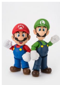
マリオとの身長差も再現