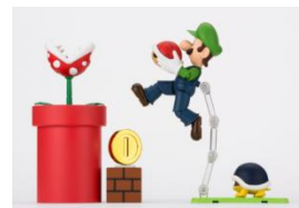
ルイージと合わせて遊べる