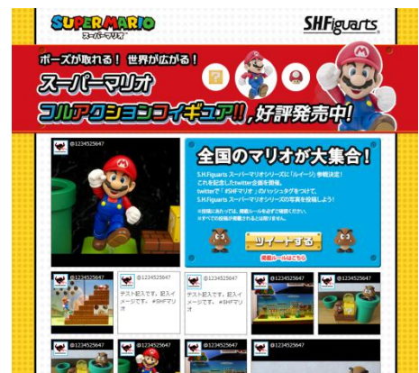
↑キャンペーンイメージ

株式会社バンダイ コレクターズ事業部が展開する商品ブランド「TAMASHII NATIONS」が贈る、「可動によるキャラクター表現の追求」をテーマに「造形」「可動」「彩色」とあらゆるフィギュアの技術を凝縮した手の平サイズのスタンダードフィギュアシリーズです。