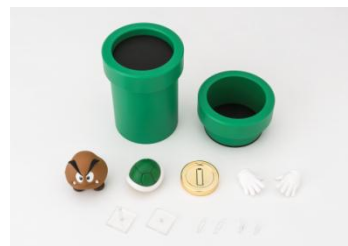
S.H.Figuarts スーパーマリオあそべる！プレイセットB