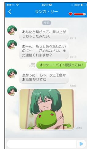
対話画面イメージ