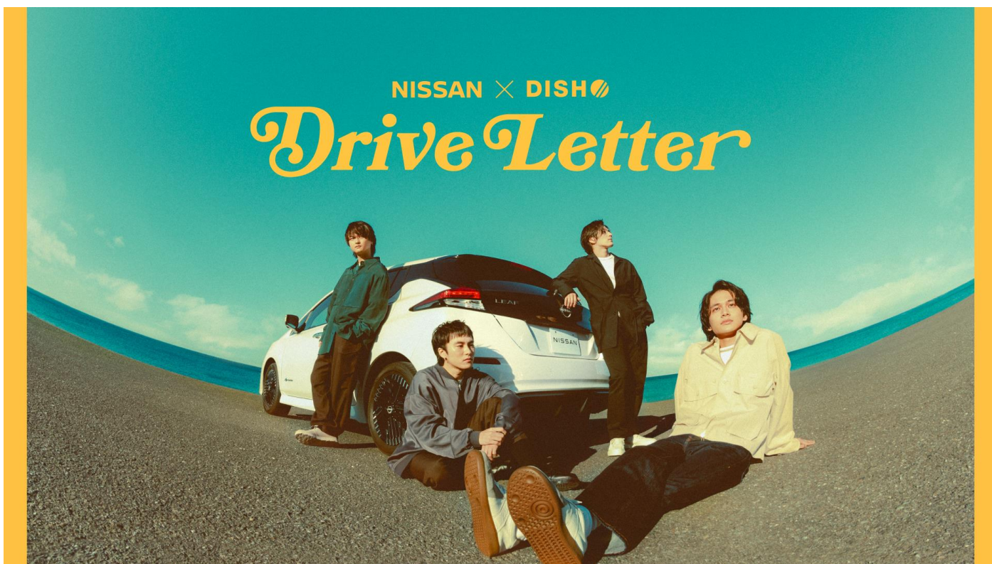
日産×DISH// コラボレーション企画「Drive Letter」メインビジュアル

日産自動車株式会社（本社：神奈川県横浜市西区、以下：日産）は、4人組バンド・DISH//とのコラボレーション企画「Drive Letter」を始動し、DISH//が書き下ろしたオリジナル楽曲「Dreamer Drivers」のミュージックビデオ（MV）を2023年11月30日（木）20:00より、DISH//公式YouTubeチャンネルにて公開いたします。さらに、MVでの各メンバーの心境を描いたスペシャルムービー「Drive Letter」と、DISH//のメンバーたちとドライブしているかのような体験ができる没入型ドライブムービー「A cappella Drive inspired by 360° safety assist」を日産公式YouTubeチャンネルにて同時公開いたします。また、SNSでは、MVで描かれたストーリーを実際に体験できる「My Drive Letter」キャンペーンも順次開始し、クルマを通じて、自分らしく一歩を踏み出す機会を提供します。