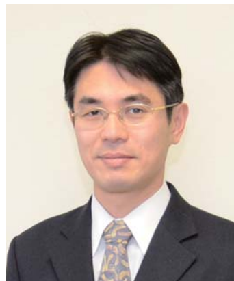
パネリスト 山下 真 (生駒市長)