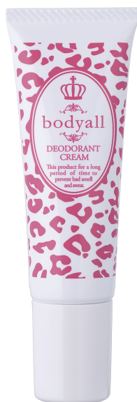
ボディオール 薬用デオドラントクリーム 1,890円(税込) 30g

化粧品を販売する株式会社 天真堂ショップ(本社:東京都江東区、代表取締役 工藤 博幸)は、女性用薬用ボディケアボディオールシリーズから、匂いが気になる夏に向けて『薬用デオドラントクリーム』を2013年4月8日(月)よりWEBサイトにて新発売いたします。