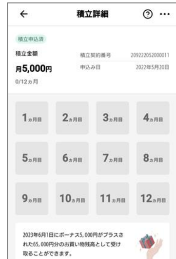
スゴ積み「積立詳細」画面