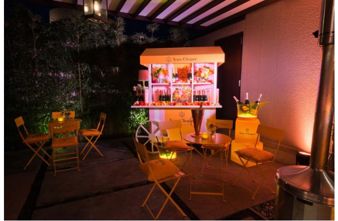
2月11日(木)から「ZERO BASE OMOTESANDO」で始まる“Say it with Clicquot! キャンペーン 2016”にも設置される、色とりどりの花が飾り付けられた花車

MHD モエ ヘネシー ディアジオ株式会社(東京都千代田区神田神保町)は、2016年2月11日(木)から14日(日)の4日間にわたり「ZERO BASE OMOTESANDO」にて開催される「Say it with Clicquot! キャンペーン 2016」に先立ち、2016年2月9日(火)にクラシカ表参道にて、オープニングパーティを開催しました。