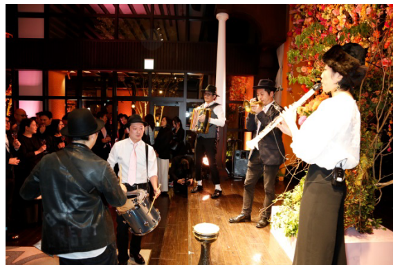
生演奏を行う「DOUBLE FAMOUS」メンバー