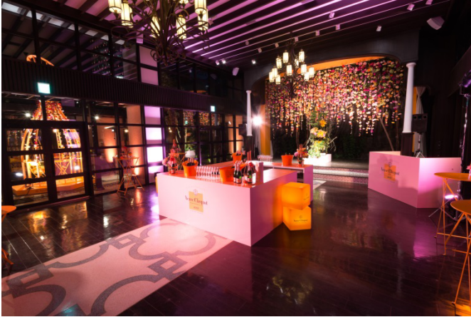
来場者に「ヴーヴ・クリコ ローズラベル」が振る舞われた、クラシカ表参道のパーティ会場