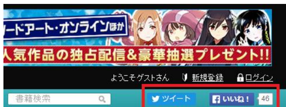
↑ 「SNS投稿ボタン」イメージ

※スコア獲得方法の詳細については、電撃文庫公式サイト 「電撃文庫CLUBとは？」( http://dengekibunko.jp/club/ )をご覧ください。