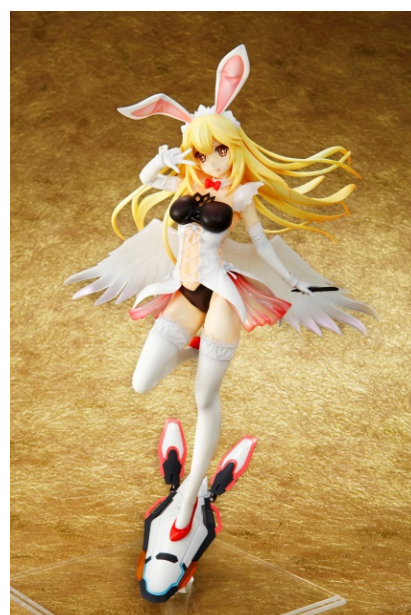
↑ 食蜂操祈 バニーメイドフィギュア