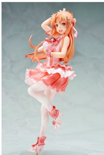
↑ 《閃光》のアスナ アインクラッドのアイドル Ver.

『ソードアート・オンライン』、『とある魔術の禁書目録』ファンの皆様には見逃せないアイテムです。ぜひご注目ください。