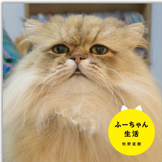
↑ 『ふーちゃん生活』表紙

写真集『ふーちゃん生活』は、Twitterのフォロワー数は7万人超、NAVERまとめでは62万超のプレビューを誇り、テレビ・新聞・ラジオなど数多くのメディアでも取り上げられている大人気猫“ふーちゃん”の一日を、全121点の撮り下ろし写真でお贈りいたします。“ふーちゃん”ならではの「しょんぼり顔」をはじめ、たくさんの味わい深い表情を、毎日の朝・昼・夜そして休日とそれぞれに分けてお楽しみいただけます。さらに「猫を飼ったことがないけれど飼ってみたい」という方必見の「猫と暮らすQ&A」も紹介しており、見どころ満載の一冊です。