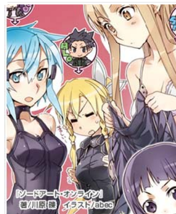
※画像はプロマイドの一部です。

さらに2日以上来場し、各日の「日替りプレゼントクイズ」に正解するとこちらの『ソードアート・オンライン』のプロマイドをプレゼント！