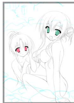
『花×華』 (著/岩田洋季) 新規描き下ろしイラストラフ