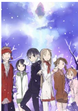
『ソードアート・オンライン』 (著/川原 礫) 新規描き下ろしイラストラフ

50点以上となる新規描き下ろしイラストを中心に、電撃文庫の魅力をグラフィカルにお届けします。