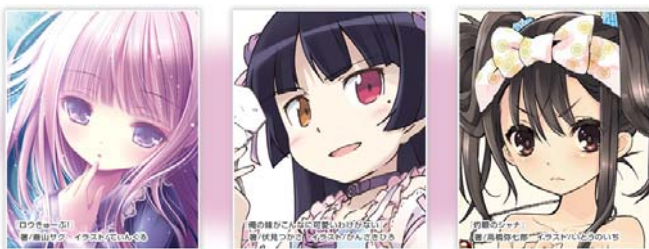
↑ 「日替りプレゼントクイズ」用新作プロマイド絵柄