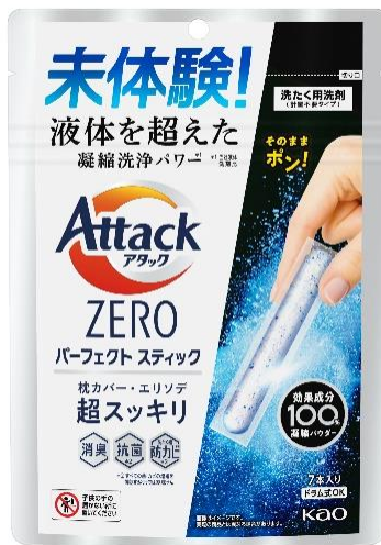
『アタック ZERO パーフェクトスティック 7本入り』