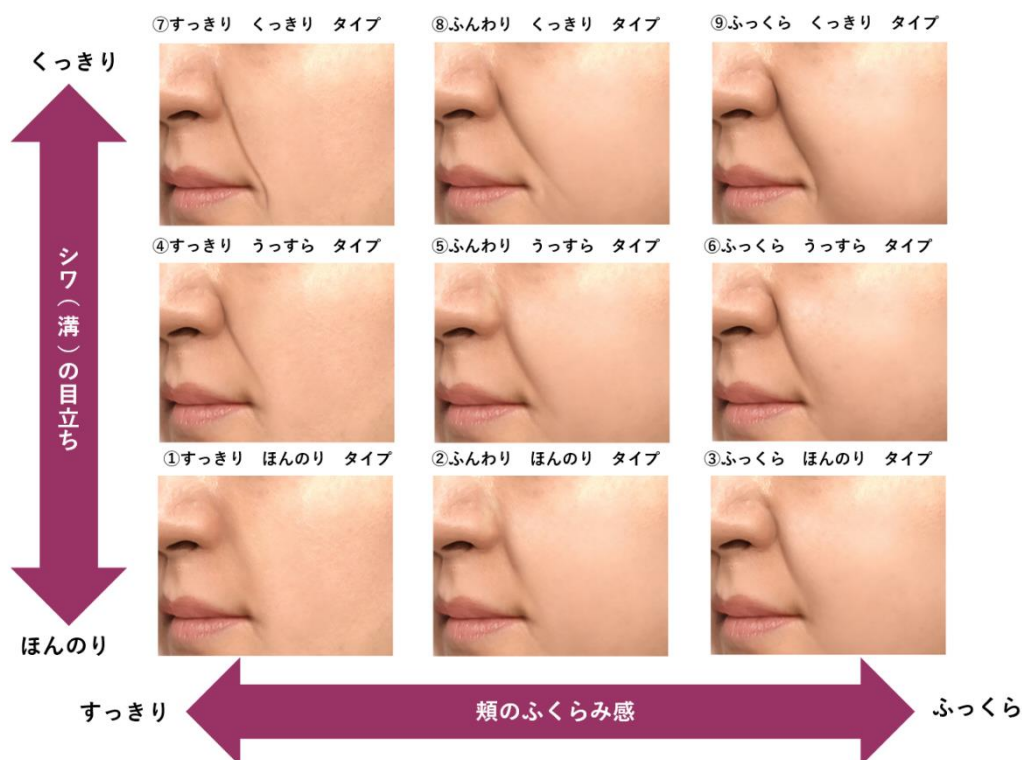
図1 ほうれい線の見え方のタイプ分類(実画像を元に作成したCGイメージ)

本商品をよりキレイに仕上げるポイントをお伝えするために、店頭では使用法や使用上の留意点についての説明を丁寧に行なうなど、きめ細かなカウンセリングを実施します。