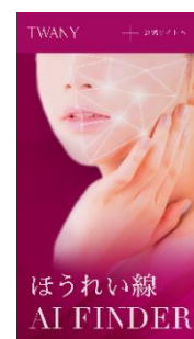
「ほうれい線 AI FINDER」 (イメージ)

また、トワニーでは、「シワ(溝)の目立ち」と「頬のふくらみ感」の掛け合わせで、ほうれい線の見え方を9タイプに分類しました。お客さまが自分のほうれい線の見え方のタイプを自宅でも確認できるよう、2022年7月に、ブランドサイト内に「ほうれい線 AI FINDER」を導入します。自撮りした顔画像をもとにAIが分析して、お客さまに近い見え方のタイプを結果として表示。お客さまのほうれい線の見え方のタイプに合わせて、ドラマティックメモリーをはじめとするメイクアイテムや使い方をご紹介します。