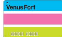
ヴィーナスフォートパスポート