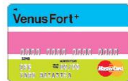
ヴィーナスフォートパスポートプラス