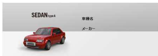
車種名・メーカー名を入力

(3)車種名、メーカー名、コメントを入力し、乗っていた年代を選択します(最大6台まで登録可能)。