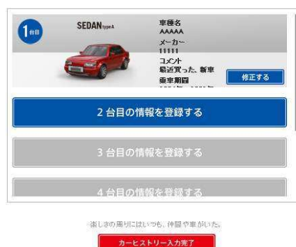
確定(最大6台まで登録可能)

(4)登録した愛車が、その年代ごとの時事ニュースや、ご自身の Facebook 内に掲載された写真を織り交ぜながら、架空の家の居間や台所などを縦横に走る自分だけのカーライフストーリーの動画が作成されます。