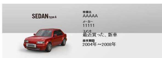
乗っていた年代を選択