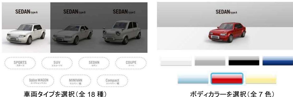
車両タイプを選択(全 18 種)

(2)7 カテゴリ・全 18 種類の車両タイプ、7 色のボディカラーの中から、今まで乗ってきた車に近いものを選択します。