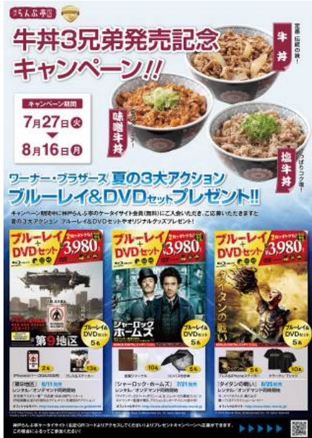
※「ワーナー・ブラザーズ 夏の3大アクションブルーレイ&DVDセットプレゼントキャンペーン」ポスターイメージ