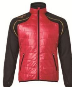
プレーイングジャケット