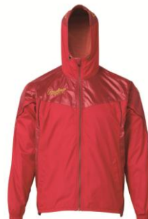
HOH ウインドパーカージャケット