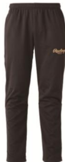
プレーイング3Dパンツ