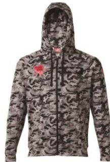
迷彩フルジップワッペンパーカーシャツ