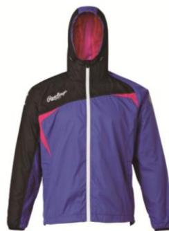
ウインドパーカージャケット