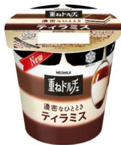
『MEGMILK 重ねドルチェ 濃密なひととき ティラミス』

※平成15年設立の日本発の家電・雑貨ブランド。プラスでもなくマイナスでもない、私達の生活をちょっと豊かにする生活家電、キッチン雑貨を提案。今回の Spoon は、ステンレス技術の最高峰、新潟県燕市で職人がひとつずつ丁寧に磨いて作ったものです。