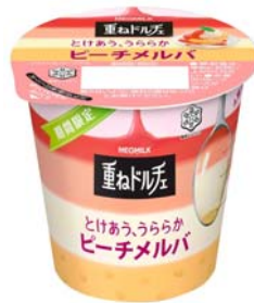
『MEGMILK 重ねドルチェ とけあう、うららか ピーチメルバ』