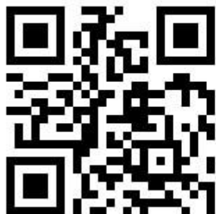
フィーチャーフォン