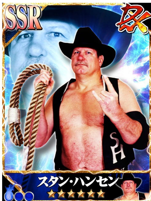
スタン・ハンセン SSR