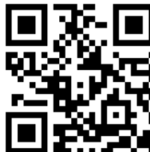
<KDDI 用 QR>