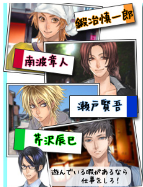
【「汐風の恋物語」イメージ画像】

第3弾は、イマドキな20歳の男子、漁師の仕事は嫌々手伝っている？「瀬戸 賢吾（せと けんご）」との、夏の恋を描きます。