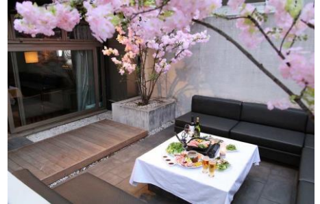
個室でカラオケ&ダーツを楽しんだ後は VIP テラス席で優雅なひと時を