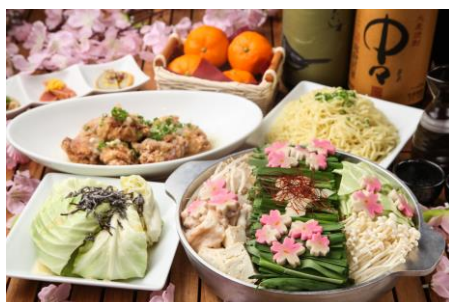
コラーゲンたっぷりのアブリもつ鍋は 料理長厳選 3 種の特製スープが選べます

「桜」+「こたつ」+「テラス」で、他にはないお花見宴会を楽しんでみていかがですか？