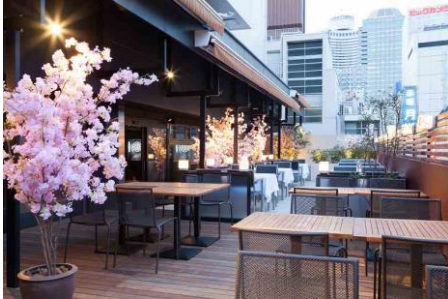
春を先取りした桜テラスは 都会のオアシス！