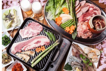
お肉はプラス 500 円で蔵牛牛に変更可能 キンキンに冷えたビールと一緒にどうぞ