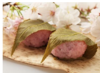
デザートは風流な春の和菓子「桜餅」