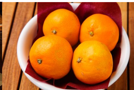
「こたつ」といえば「みかん」！ デザートに完熟みかんをどうぞ