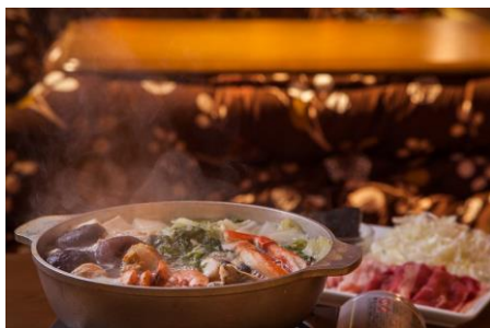
海鮮鍋の後に豚しゃぶしゃぶが味わえる ハイブリッド鍋「海鮮鍋しゃぶ」登場！

今年の鍋は定番「もつ鍋」の他、新たに「海鮮鍋しゃぶ」が加わりました。「海鮮鍋しゃぶ」は海鮮たっぷり鍋の後に、豚しゃぶしゃぶも楽しめるオリジナル鍋。厳選した海鮮（ホタテ、エビ、ホキ、あさり、カニ）にはアミノ酸、タウリン、ビタミンB12など日本人に不足がちな栄養素がたっぷり含まれているので、これからの寒い季節にぴったりです。海鮮鍋を楽しんだ後は海鮮エキスが染み出た出汁でいただく「豚しゃぶしゃぶ」を堪能していただけます。アクセントのだし昆布がさらに旨味を引き出します。2種類の鍋が一度に味わえるハイブリッドな鍋です。