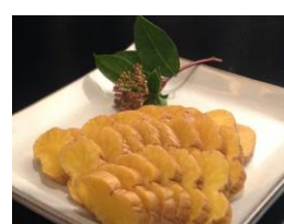
左から、愛媛県の河内晩柑・ベビー椎茸、秋田県のパルベリー・いぶりがっこ