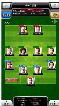
チーム管理 イメージ