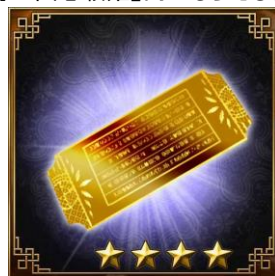
★4以上確定ガチャチケット