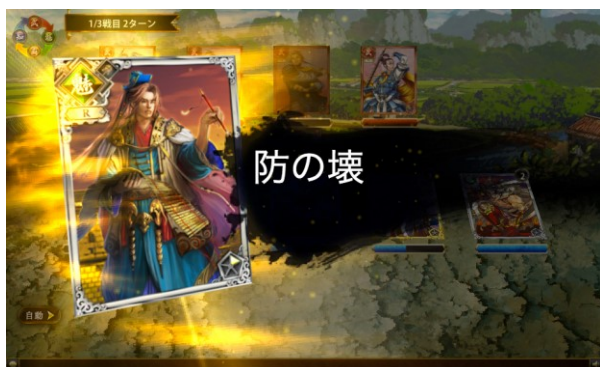
軍師のスキルを発動させ、バトルの戦況を有利に！