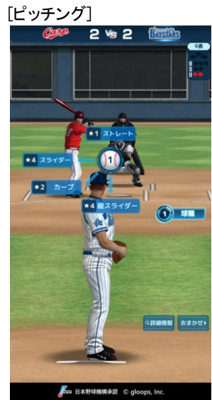
持ち球を駆使して ピンチを切り抜ける!