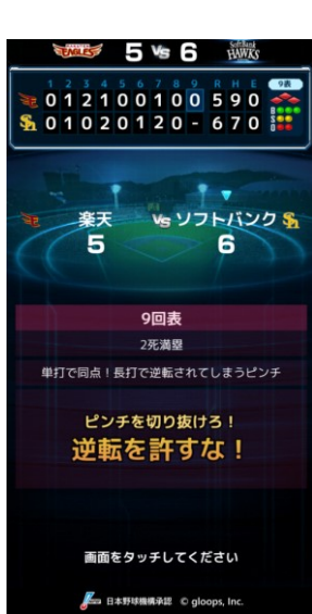
勝負の局面は プレイヤー自信の手で