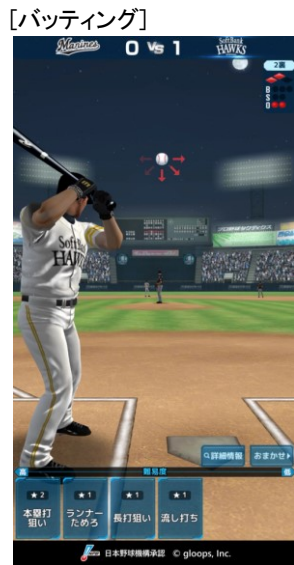
戦況に応じて 最適な打撃を選択