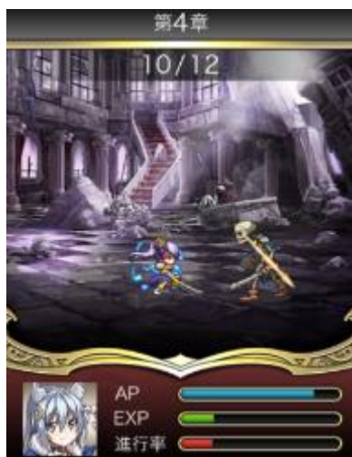
クエスト イメージ