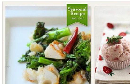
レシピサイト「ナディア」