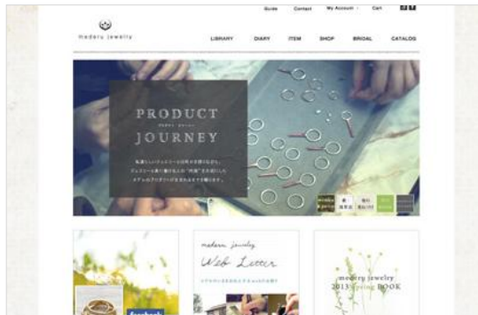
メデルジュエリー