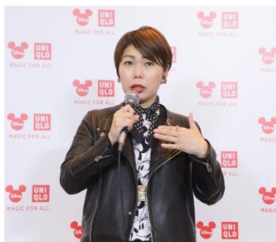
飯嶋さんの登壇時