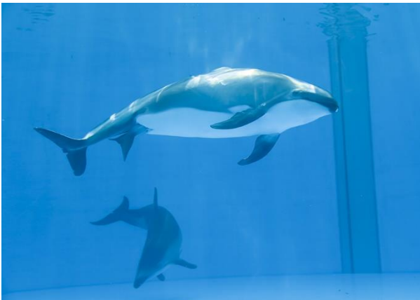
8月6日 赤ちゃんの尾ビレが出現