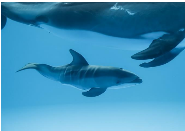
8月6日 誕生してすぐのカマイルカの赤ちゃん