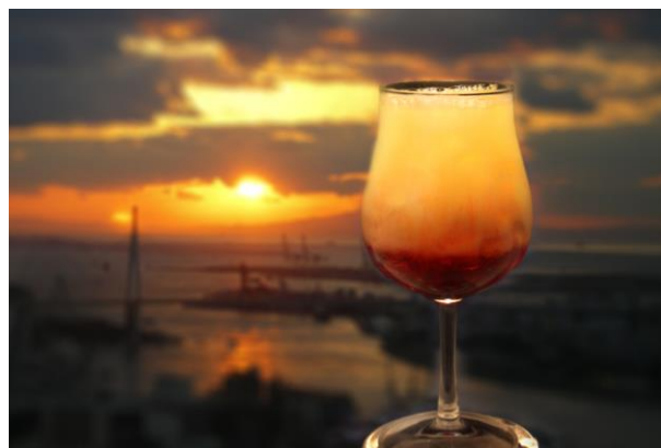
「Sunset200」(写真はイメージです。)