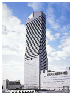
ホテル大阪ベイタワー外観