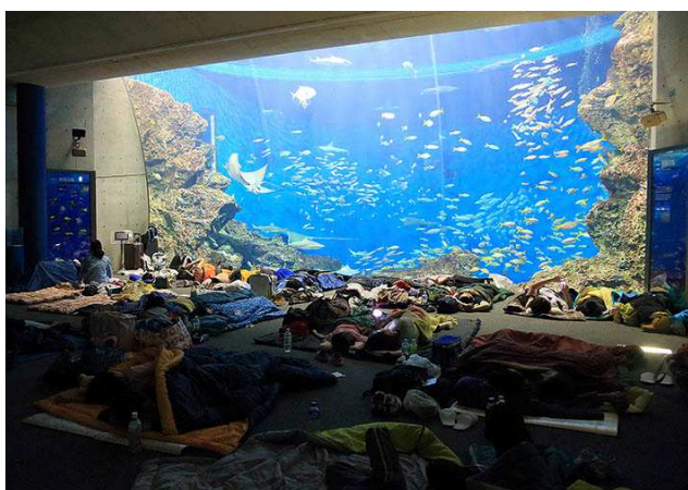
トロピカルアイランド・ナイトステイ