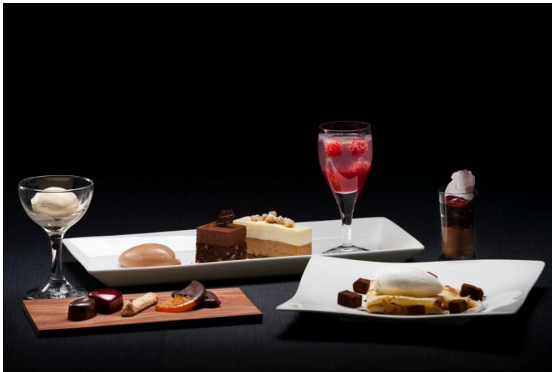
札幌グランドホテル スイーツシンフォニー

株式会社グランビスタ ホテル&リゾート(本社:東京都中央区、代表取締役社長:須田貞則)は、グランビスタグループとして、札幌グランドホテル、札幌パークホテル、ホテル大阪ベイタワー、銀座グランドホテルの4ホテルつのレストランにて、2016年2月1(月)～2月29日(月)の期間、バレンタインフェアを開催することをお知らせ致します。