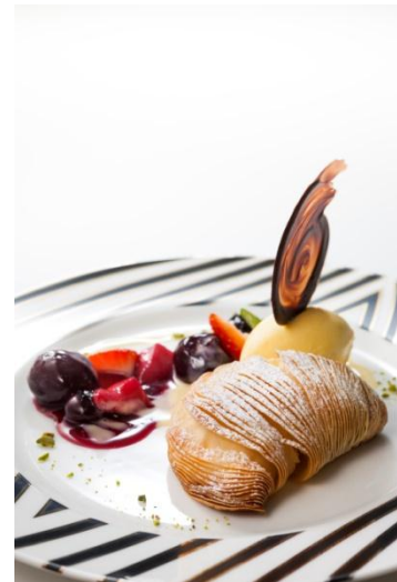
スフォリアテッラとバニラアイスクリーム

ホテルレストランならではの上質なおもてなしと、特別なスペシャルコースやスイーツをご用意いたしました。感謝の気持ちや愛情を込めて、大切な人と、ゆったりと上質なひと時をお過ごしください。