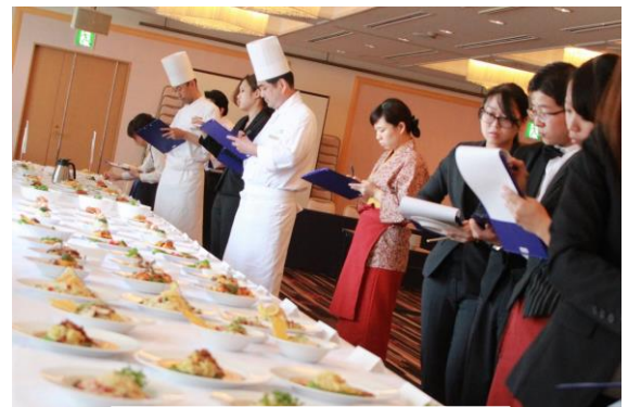
料理コンテスト 審査の様子

2016年9月9日に開催。グランビスタホテル&リゾートが掲げるアクションポリシーである「フロンティアスピリットを持ち挑戦しよう」に基づき、総勢38名の調理スタッフが参加。食事部門「麺料理の可能性」とスイーツ部門「新食感・新感覚」の2部門に分かれて腕をふるい、新メニューの創作を競い、ホテル従業員が厳正なる審査を行いました。