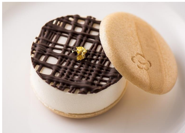
「コーン茶(ていらみず最中)」イメージ

食事部門の最優秀賞「イタリアン ソーメングラタン」は、日本の食材である素麺を洋風に大胆にアレンジし、グラタンのように仕立て、素麺の可能性を追求した一品です。スイーツ部門「コーン茶(ていらみず最中)」はコーン茶と白あんを使用したティラミスと最中を合わせたフュージョンスイーツで、ハイブリットな新感覚をお楽しみいただけます。それぞれの部門で勝ち抜いた独創性のある一品をご堪能ください。「イタリアン ソーメングラタン」は、51階スカイラウンジ「エアシップ」のランチバイキングに、「コーン茶(ていらみず最中)」は1階ロビーラウンジに登場します。