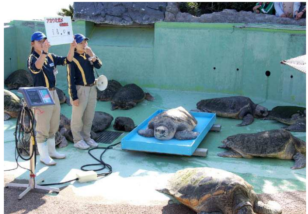
ウミガメの体重測定