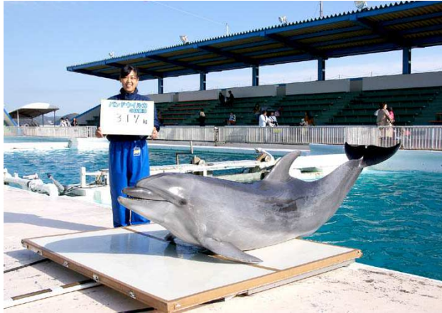
イルカの体重測定