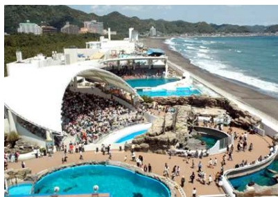
鴨川シーワールド 園内俯瞰