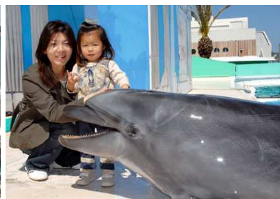
動物とのふれあい体験「イルカにタッチ」