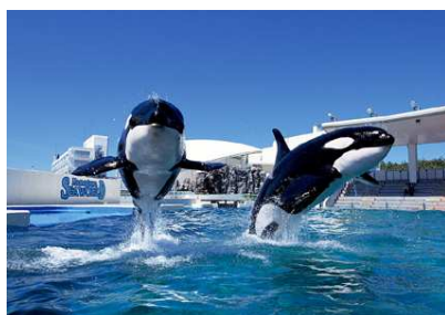
豪快なシャチパフォーマンス