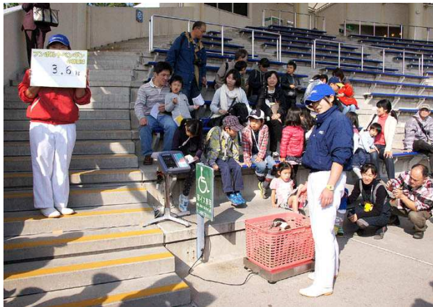
ペンギンの体重測定